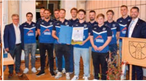
Mannschaft Fußball 1