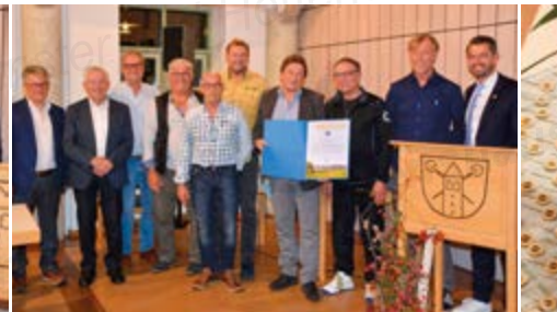
Mannschaft Herren 60