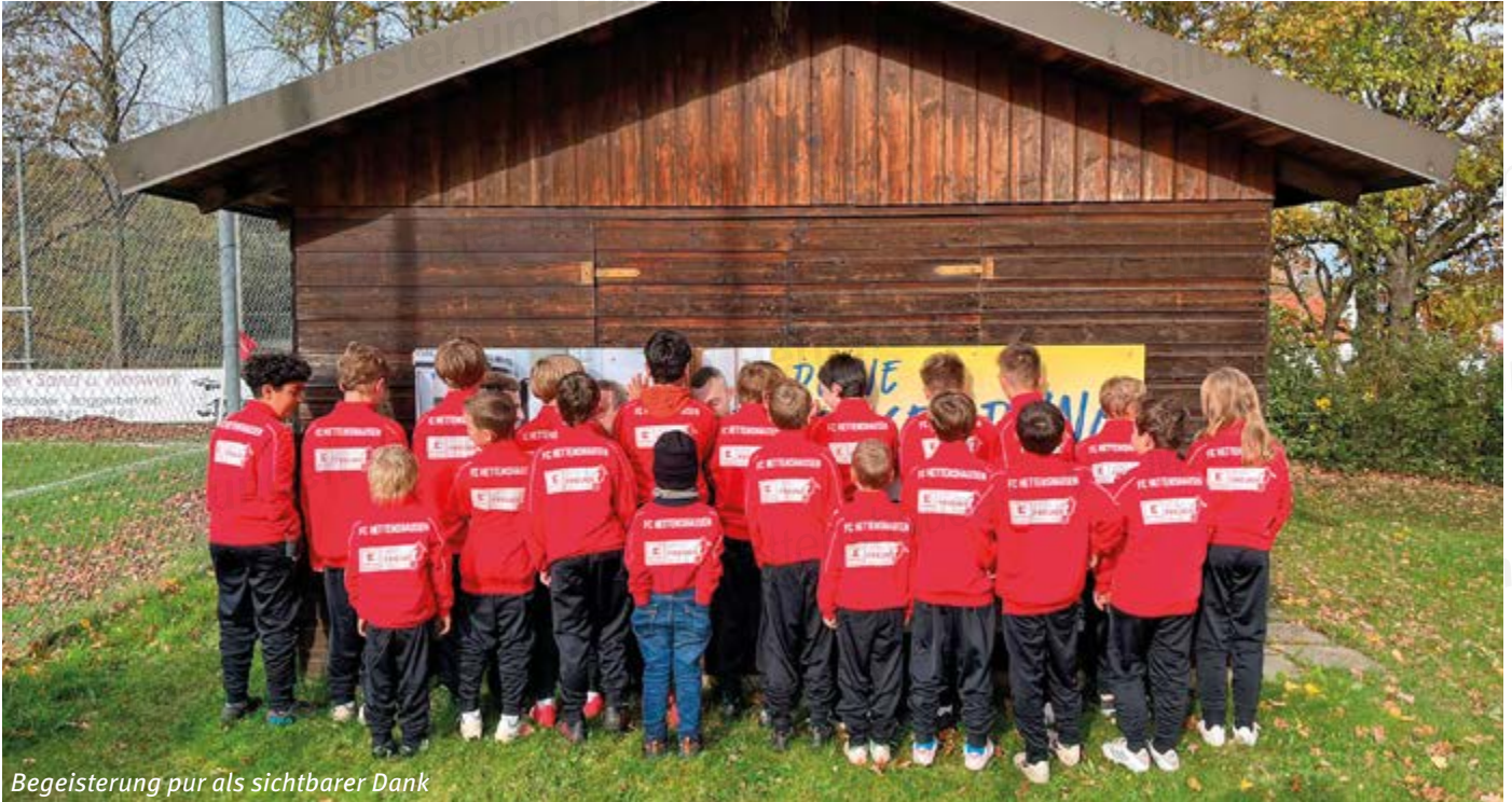
Begeisterung pur als sichtbarer Dank

Ein herzlicher Dank gilt der Firma Kaufland Pfaffenhofen für die Ausrüstung der Jugendmannschaften mit tollen, neuen Trainingsanzügen und Trikots. Gemeinsam am Ball!