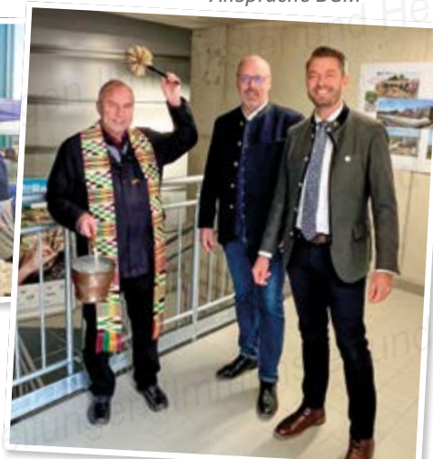
Segnung Pfarrer und Bürgermeister