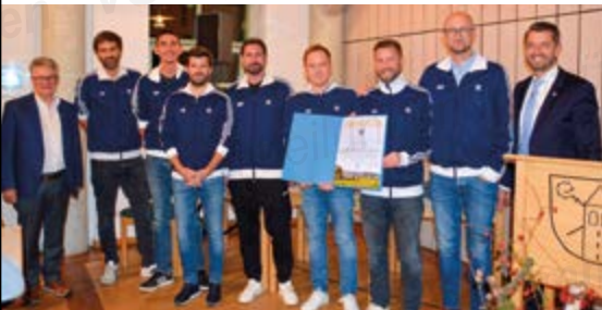
Mannschaft Herren 30