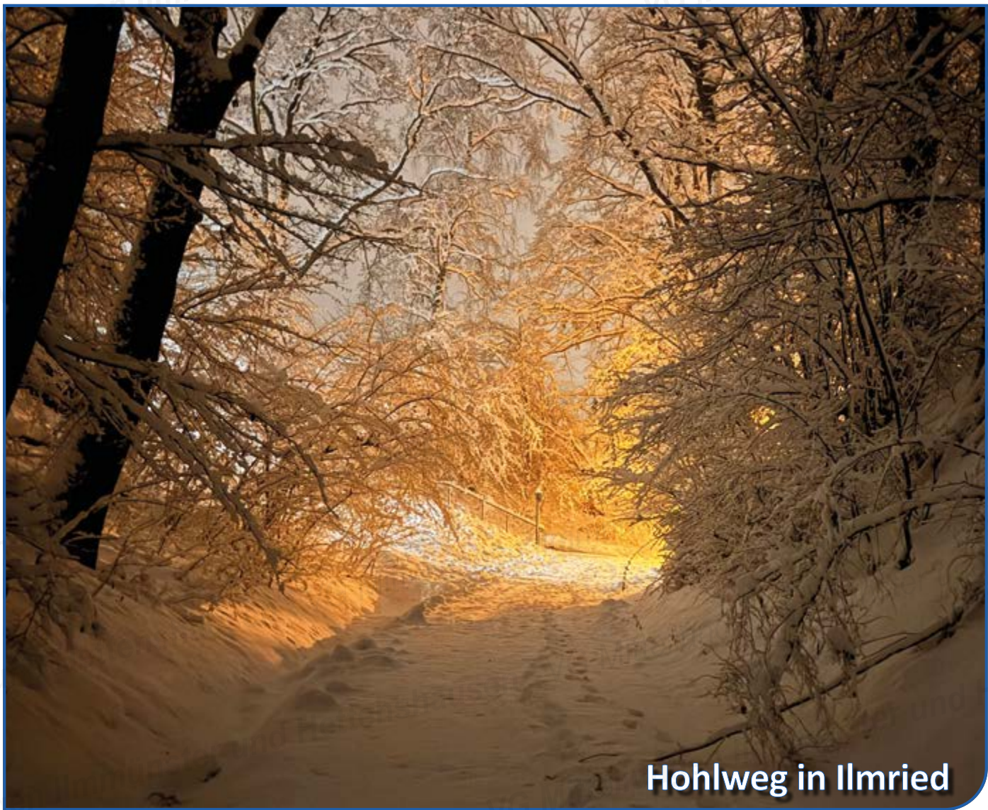
Hohlweg in Ilmried

MITTEILUNGSBLATT FÜR DIE VERWALTUNGSGEMEINSCHAFT DER GEMEINDEN ILMMÜNSTER UND HETTENSHAUSEN