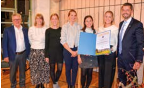
Mannschaft Damen Tennis