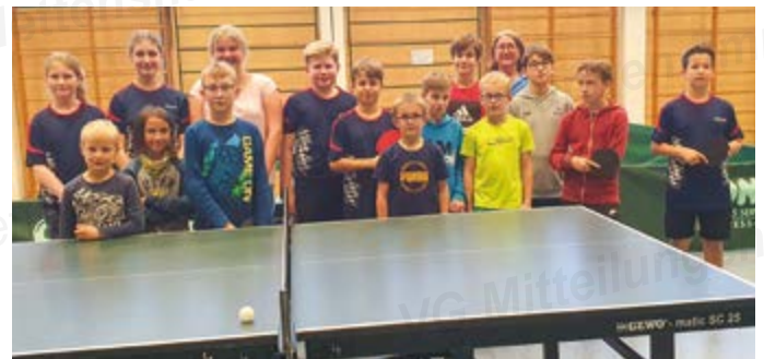
Teilnehmer der mini-Meisterschaften 2022