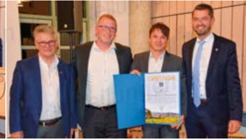
Mannschaft Fußball 2