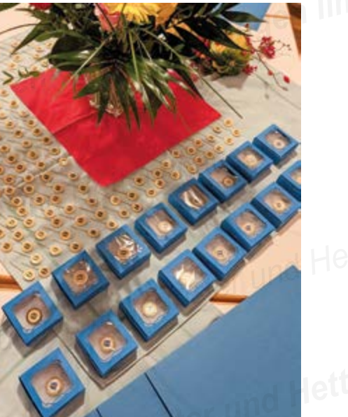
Nadeln und Urkunden