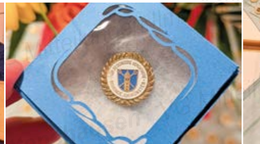
Nadel in Gold