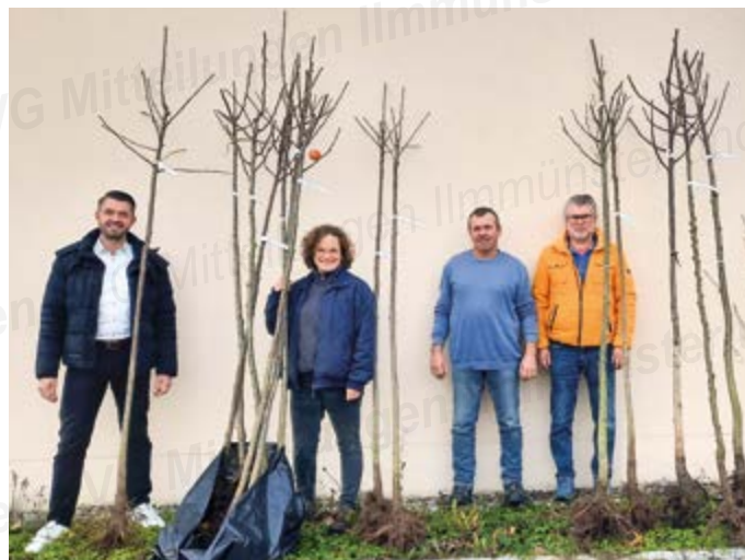
Einige der neuen Obstbaumbesitzer zusammen mit dem Ersten Bürgermeister Georg Ott und der Zweiten Bürgermeisterin Brigitte Wallner

wie Vogelkirsche, Holzapfel, Wildbirne, Eberesche, Speierling, Elsbeere, Maulbeere, Esskastanie oder Mispel. Gefördert wird ausschließlich der Kauf von hochstämmigen Obstgehölzen mit bis zu 45 € pro Baum.